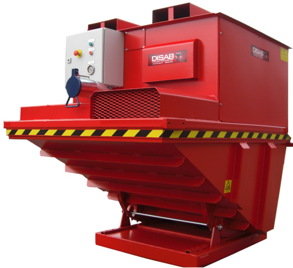
SkipVac, ett litet vakuuaggregat som hanteras med gaffeltruck