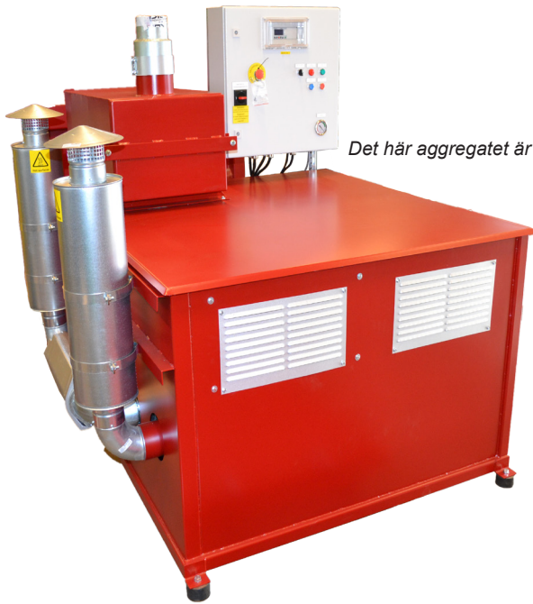
Det här aggregatet är utrustat med tillval

PES-6 skall alltid anslutas till en filteravskiljare för att bli ett komplett vakuumsystem