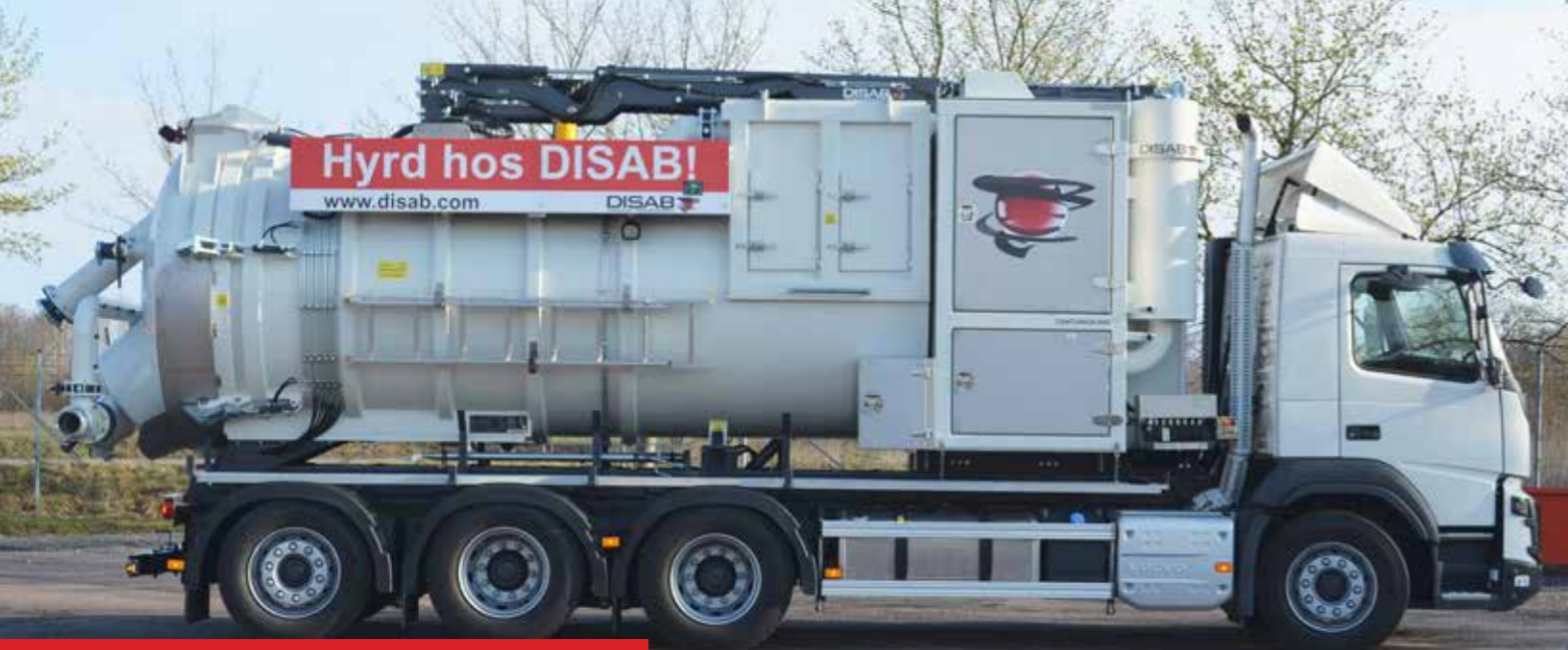
DISAB Centurion™ P20