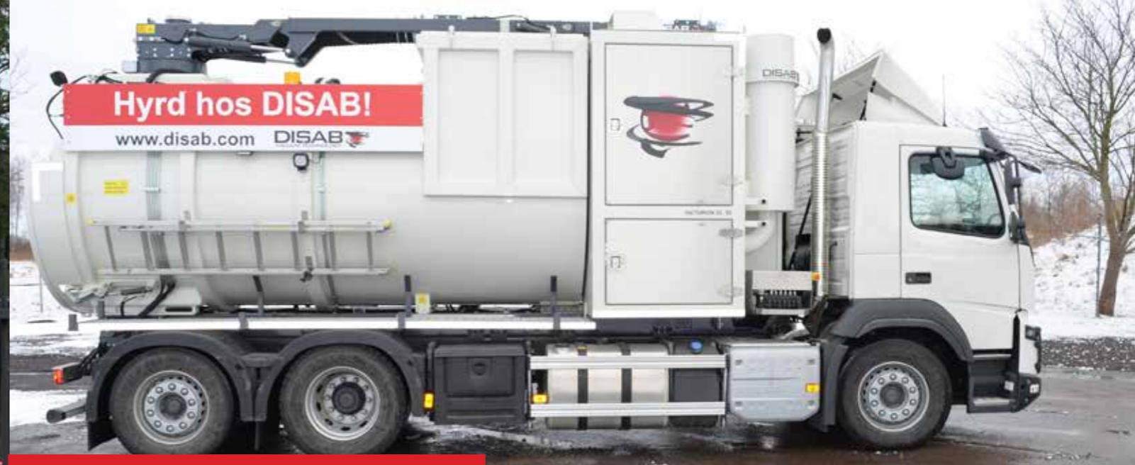
DISAB Vacturion™ DL10